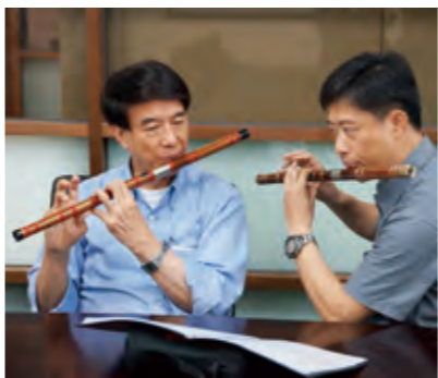
▲朱經武活到老學到老，趁著此次返台，特地抽空學習竹笛，三個小時後已能吹出簡單童謠。

為成品、商品的人才。「但就升遷制度來講，其實還是有值得改進的空間，因為目前升遷與審評制度皆著重在學術研究上，在成品化、商品化上注意力較為不足，所以大家就較易偏向從事學術研究。」朱經武表示，教育不成功跟社會有相當重要的關聯性，在一所理想的大學殿堂裡，除了創造新知識、發展新技術、教育明天的領袖，最重要的是，培養學生一顆關懷社會的心，未來得以將所學回饋社會，成為能為社會所用的人才。