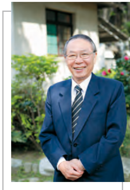
國立成功大學校長

目前國際競爭十分激烈，各行各業都必須有獨特的經營策略，才能出人頭地，屹立不搖，甚至達到唯一領先的境界，所以成大大不論是校友或在學同學，都應有深切的體認，除了本身專業之外，更需從旁攝取其他不同領域的知識，充實自我，以做為未來獨特、多元化的發展基礎，進而掌握先機，開創與他人不同的局面，讓國內外都能看到成大校友耀眼的表現。