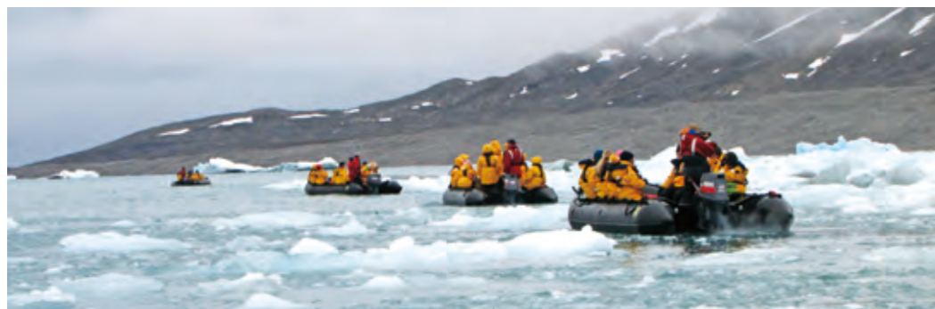
▲ 乘坐登陸小艇準備登陸上岸。