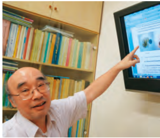
成大購入亞洲首台風力移動式光達

成功大學購入亞洲第一台浮動式量測設備——風力移動式光達，五月二十四日於安南校區水工試驗所舉行擲瓶儀式。