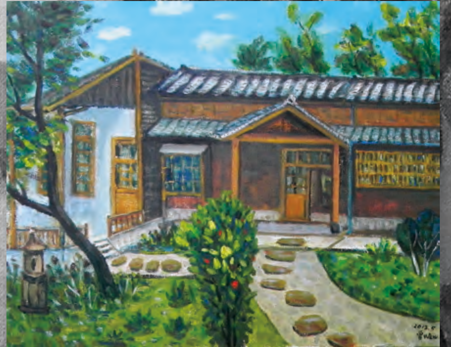
▲「八田與一紀念館」(65X91公分)

回來後，畫了兩張油畫：「從招待所看潭景」以及「八田與一紀念館」。（水庫興建事蹟參考徐欣忠撰述文）