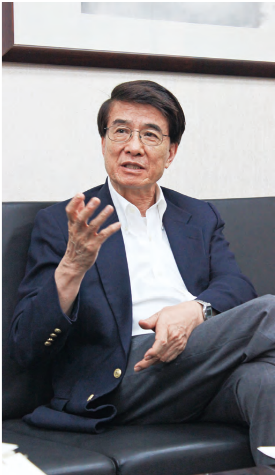
文／陳宜彰