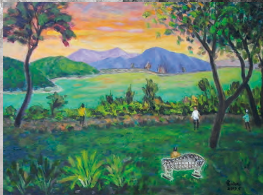
▲「從招待所看潭景」(60X80公分)